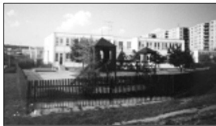
Mateřská škola Michalová, která již dlouhodobě spolupracuje s Magistrátem města v oblasti úspor energie

V návaznosti na předběžné energetické audity a výsledky získané periodickým sledováním potřeb energií jsou u objektů s nevyššími měrnými spotřebami energií prováděny podrobné energetické audity. Ty mají za cíl odhalit zdroje energetických úspor a doporučit realizaci efektivních opatření pro jejich dosažení.